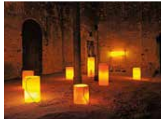
Gutbrod (c) Inka Meisner

nimmt mit ihrem Motto Bezug auf das traditionelle Goldschläger- handwerk in der Stadt und findet bereits zum dreizehnten Mal statt. Ihr besonderer Charme liegt in der Präsentation der Kunstwerke, denn für „ortung“ werden öffentliche Plätze, Kellergewölbe, Grünflä- chen, Kirchen, Galerien, alte Ladengeschäfte oder Privaträume zu Ausstellungsorten. Insgesamt 28 teilnehmende Künstlerinnen und Künstler verschiedener Sparten öffnen mit ihren Arbeiten neue und überraschende Kunstperspektiven.