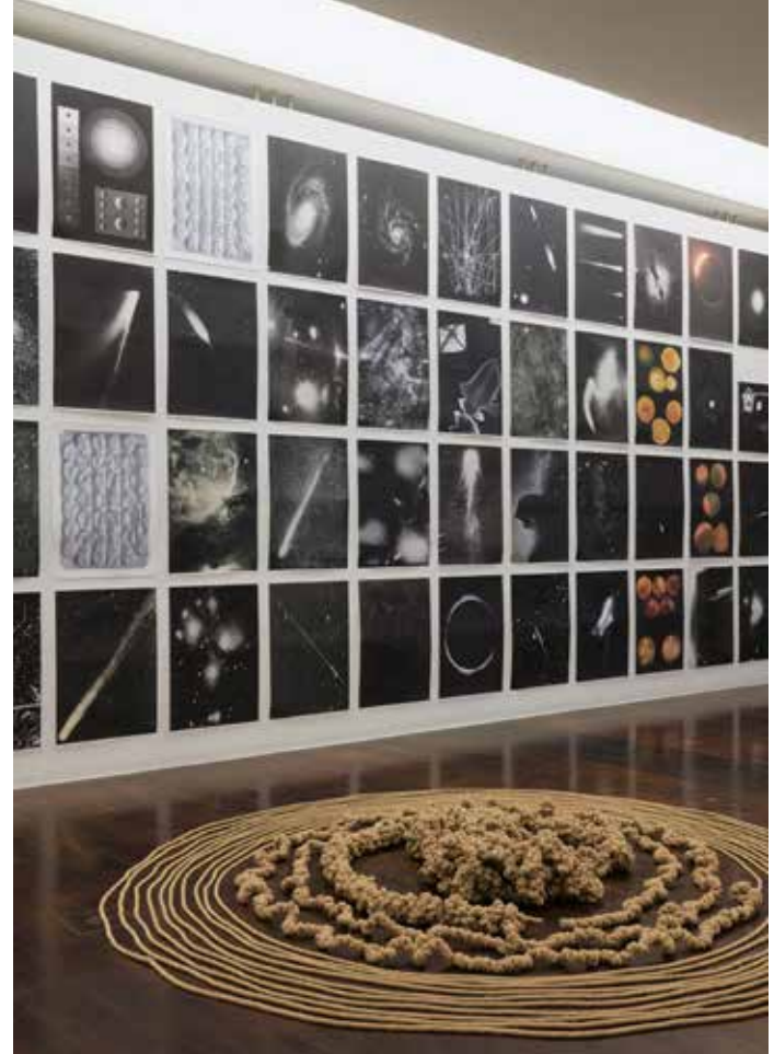
Batja Suter, Maxisculc, 2023, Wandinstallation mit 48 Fine Art Prints; vorne: Jens Risch Knotenzyklus, 2023, Bodeninstallation, fünf 100-Meter-Hanfseile: von außen nach innen: ungeknotet, einfach, 2-fach, 3-fach und 4-fach geknotet, Courtesy Jens Risch & Bischoff Projects, Ausstellungsansicht „Blind Date“ 2023, Foto: Annette Kradisch

Ich habe etwa die Reihe „Display“ ins Leben gerufen. Die Kunstgalerie Fürth hat eine große Fensterfront zum Königsplatz an einer vielbefahrenen Kreuzung. Das Fenster wurde aktiviert, um KünstlerInnen einzuladen, in regelmäßigen Abständen diese Fensterfront zu bespielen. Die Idee ist in der Pandemie entstanden, weil alles geschlossen war und die Sichtbar-