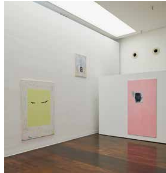
Christina Chirulescu, Ausstellungsansicht „open-ended“ 2021, Foto: Annette Kradisch

AR: Es hängt auch mit der verstärkten Nutzung des Internets insbesondere durch kleine Vereine und KünstlerInnen – gerade auch der älteren Generation - zusammen, die inzwischen Werbung auf Instagram für ihre Veranstaltungen machen.